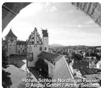
Hohes Schloss Nordflügel Füssen