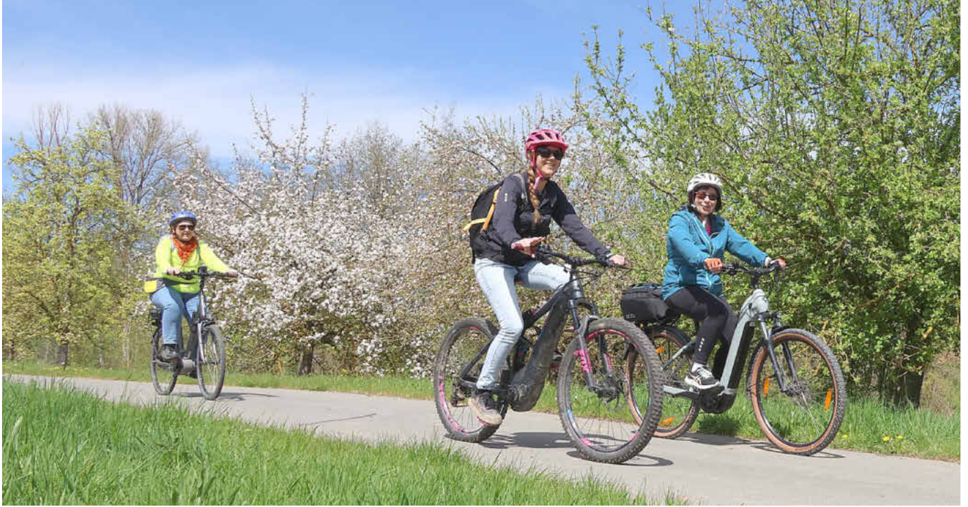
Radwandern während der Obstbaumblüte

Amtliches Bekanntmachungsorgan des Marktes Ebensfeld