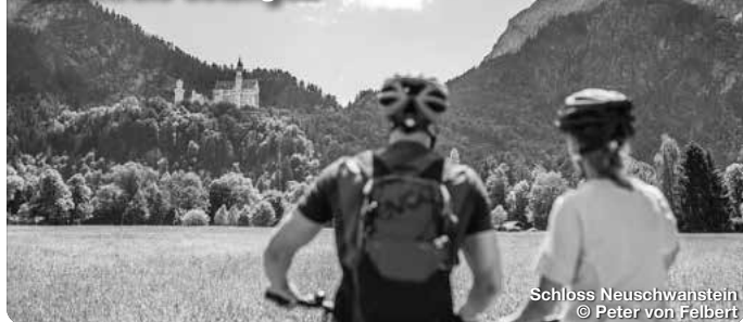
Schloss Neuschwanstein

Wie ein Schatzkästchen liegt er im Herzen des Allgäus, im bayerischen Süden Deutschlands. Er ist einer von neun Erlebnisräumen der Region und erstreckt sich über den gesamten Landkreis Ostallgäu, von Füssen über Pfronten, Nesselwang, Halblech, Marktobderdorf bis nach Kaufbeuren und Buchloe. Die königliche Gipfelkulisse aus Ammergauer, Allgäuer und Tannheimer Bergen wachen wie steinerne Riesen über mystische Seen, rauschende Flüsse, sanft gewellte Hügelmeere und sattgrüne Wiesen, zwischen die Dörfer und historischen Städte eingebettet sind. Die archaische Poesie der Landschaft wirkt wie ein großer, weiter Park, der sich vor den vielen Schlössern und Burgen der Region ausbreitet, vor allem zu Füßen des Märchenschlosses Neuschwanstein. TreffpunktDeutschland.de/ostallgaeu