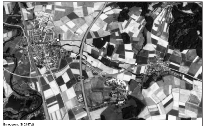
Erneuerung St 2187alt

Das Staatliche Bauamt Bamberg dankt für das Verständnis und bittet um erhöhte Aufmerksamkeit auf den Umleitungsstrecken.