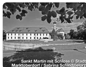
Sankt Martin mit Schloss Marktobderdorf

Der Allgäuer Urlaubsort liegt inmitten einer traumhaften Landschaft mit herrlichem Panoramablick auf die Berge und Seen, ideal für Wanderer und Radfahrer. Tipps: Fahrt mit der Sesselbahn auf den Buchenberg und mit dem Wanderbus ins Ammergebirge. TreffpunktDeutschland.de/halblech