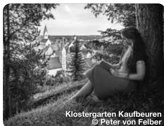
Klostergarten Kaufbeuren

Wie ein Schatzkästchen liegt er im Herzen des Allgäus, im bayerischen Süden Deutschlands. Er ist einer von neun Erlebnisräumen der Region und erstreckt sich über den gesamten Landkreis Ostallgäu, von Füssen über Pfronten, Nesselwang, Halblech, Marktobderdorf bis nach Kaufbeuren und Buchloe. Die königliche Gipfelkulisse aus Ammergauer, Allgäuer und Tannheimer Bergen wachen wie steinerne Riesen über mystische Seen, rauschende Flüsse, sanft gewellte Hügelmeere und sattgrüne Wiesen, zwischen die Dörfer und historischen Städte eingebettet sind. Die archaische Poesie der Landschaft wirkt wie ein großer, weiter Park, der sich vor den vielen Schlössern und Burgen der Region ausbreitet, vor allem zu Füßen des Märchenschlosses Neuschwanstein. TreffpunktDeutschland.de/ostallgaeu