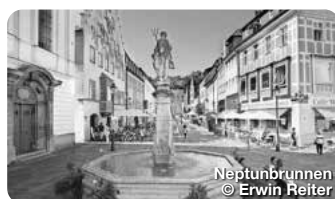
Neptunbrunnen © Erwin Reiter

Schulklassen, Familien und andere Besucher erfahren hier spielerisch vieles über den Lebensraum Wald und erleben hautnah Wald und Förster. Es wartet ein großes Freigelände mit den beiden Themenwegen Bergwaldpfad und Auwaldpfad. Tiroler Str. 10, Füssen