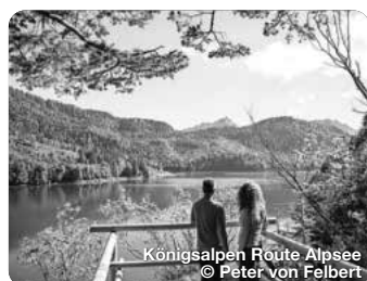
Königsalpen Route Alpeee