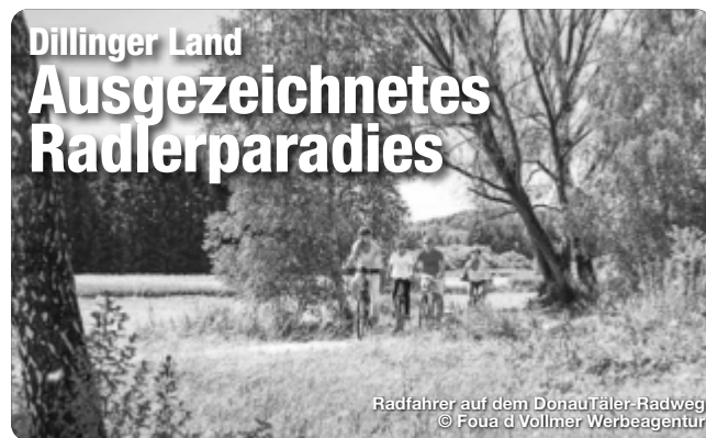
Radfahrer auf dem DonauTäler-Radweg

Am besten lässt sich das vielfältige Dillinger Land mit dem Rad erkunden. Mehr als 15 abwechslungsreiche Tagestouren führen durch den landschaftlichen Dreiklang zwischen Alb, Donautal und Voralpenland – und machen die Region somit zu einem echten Paradies für Radfans. Radlergenuss pur bieten auch die beiden der 4-Sterne-Radwege Donautäler und Donauradweg. Ein besonderes Highlight ist der Radrundweg zu den Sieben Wegkapellen. Er verbindet auf 153 Kilometern sieben einzigartige Kapellenbauten miteinander – wahre architektonische Unikate und