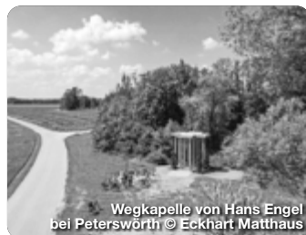
Wegkapelle von Hans Engel bei Peterswörth