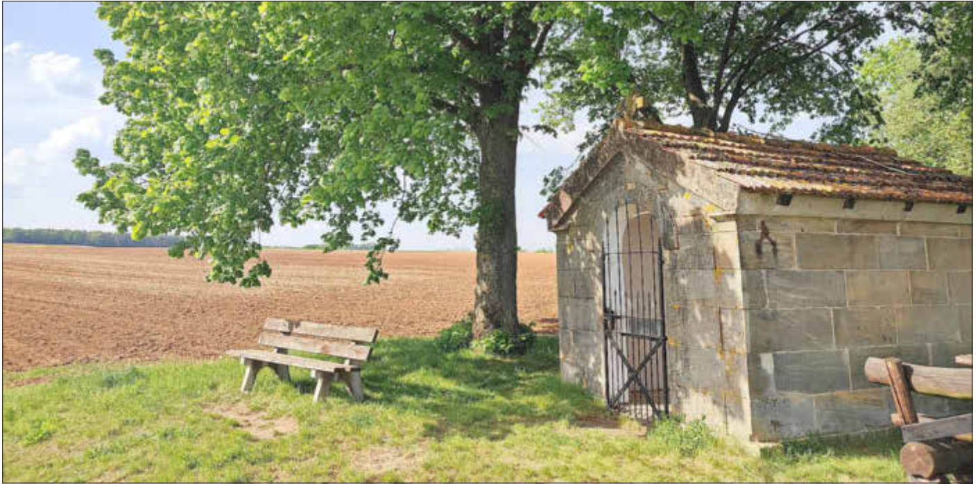
Kapelle in der Döringstadter Flur

Amtliches Bekanntmachungsorgan des Marktes Ebenfeld