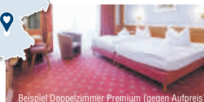
Beispiel Doppelzimmer Premium (gegen Aufpreis)