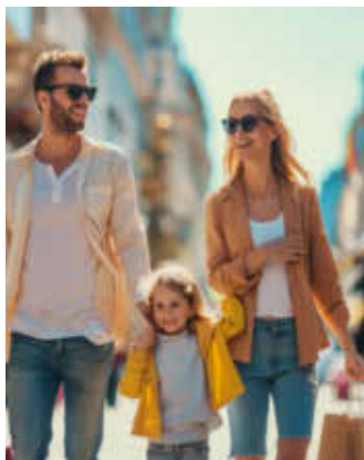
(KI generiert)

(DJD). Spätestens seit der Pandemie ist Online-Shopping für viele Menschen in Deutschland zur alltäglichen Routine geworden. Im Gegenzug leiden viele Innenstädte unter hohen Leerständen. Unter Umwelt- und Nachhaltigkeitsaspekten keine positive Entwicklung, denn der Einkauf im regionalen Handel hat gegenüber dem Online-Shopping in dieser Beziehung viele Vorteile.