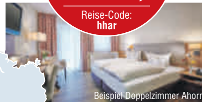
Beispiel Doppelzimmer Ahorn