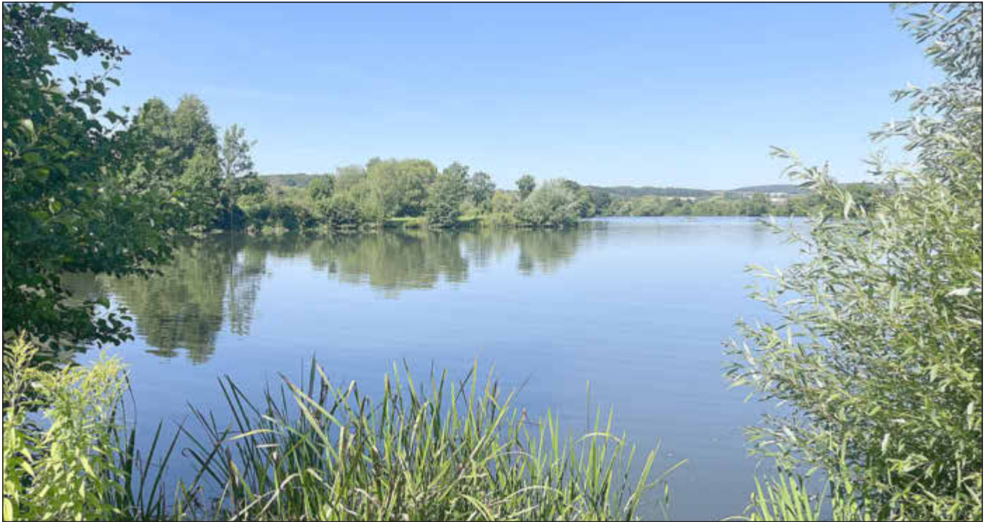
Badesees Ebenfeld

Amtliches Bekanntmachungsorgan des Marktes Ebenfeld