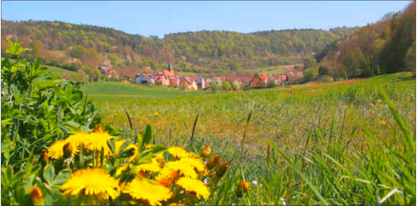
Blick auf Oberküps

Amtliches Bekanntmachungsorgan des Marktes Ebenfeld